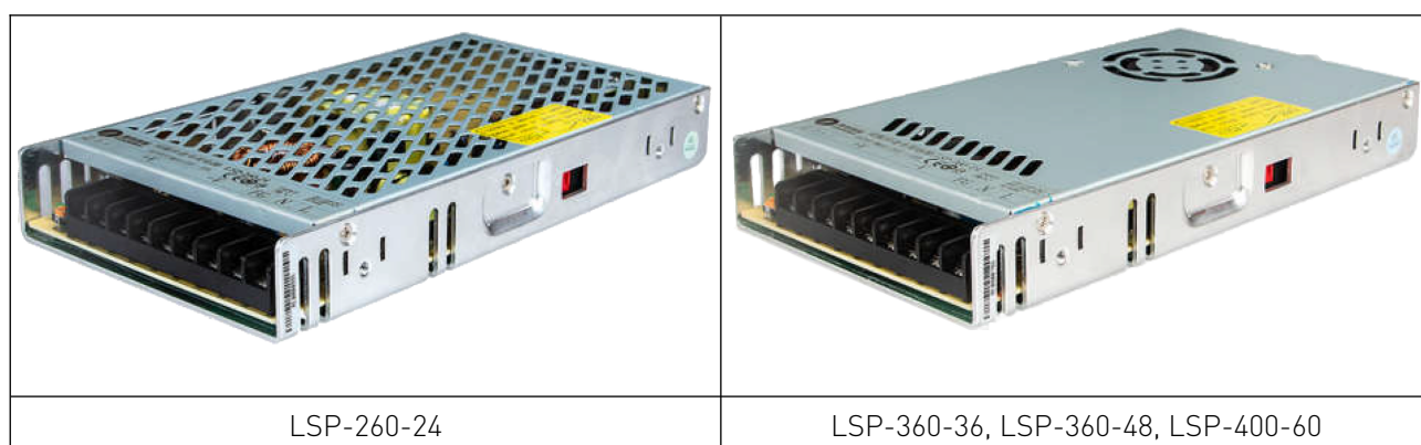
Рисунок 1 – Импульсные источники питания.