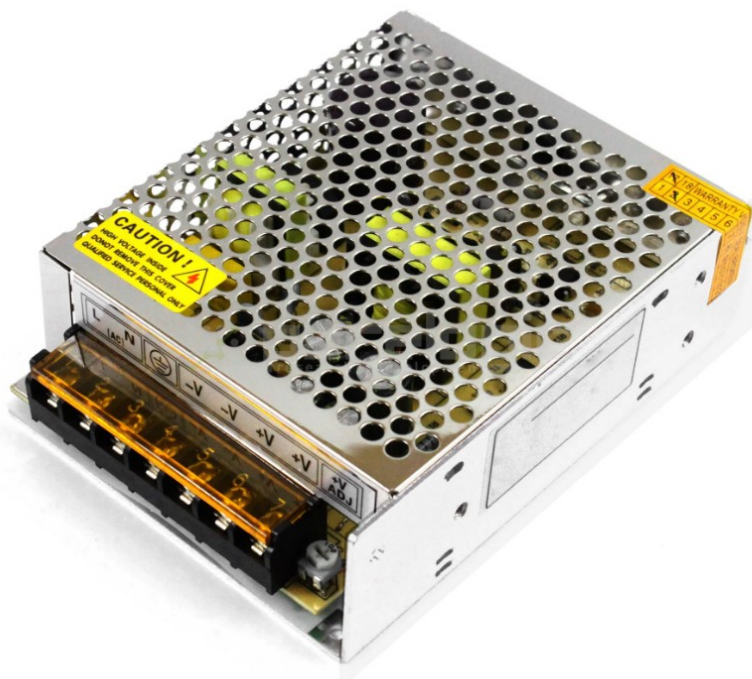
Рисунок 1 – Импульсный источник питания GD-60-12-24.