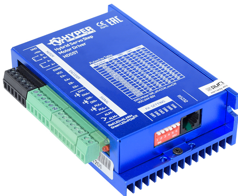
Рис.1. Внешний вид драйвера